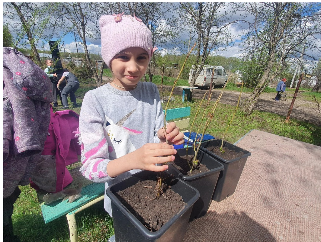
Полевая практика «ЭКО сторис» (пересадка укорененных черенков в контейнеры, 1500 шт.)