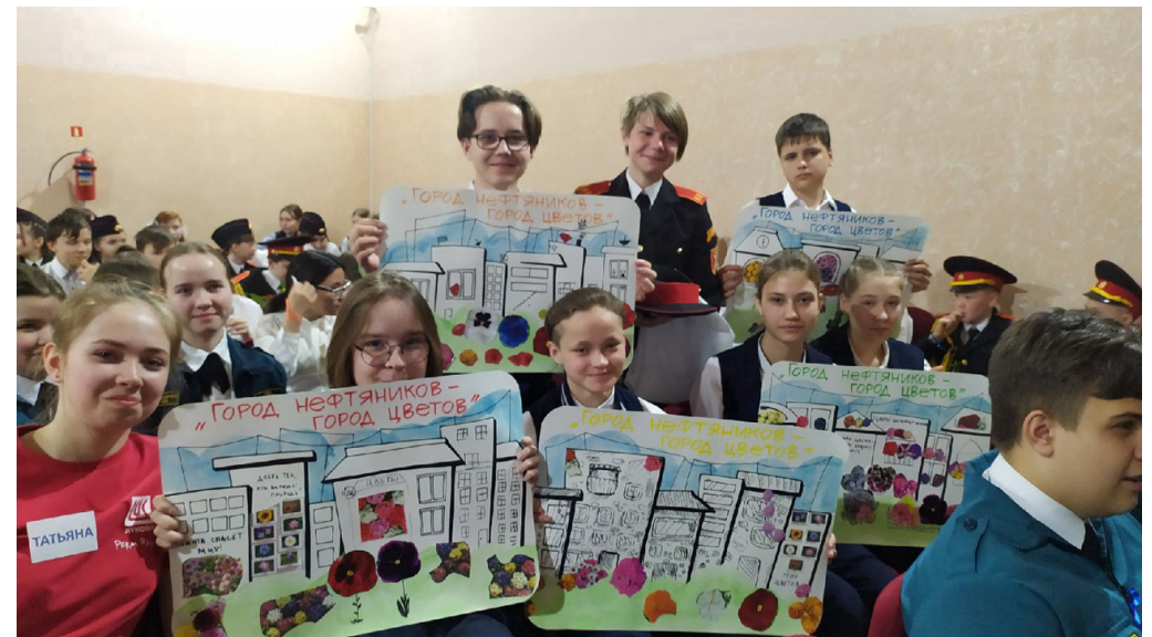
Открытие экологических акций